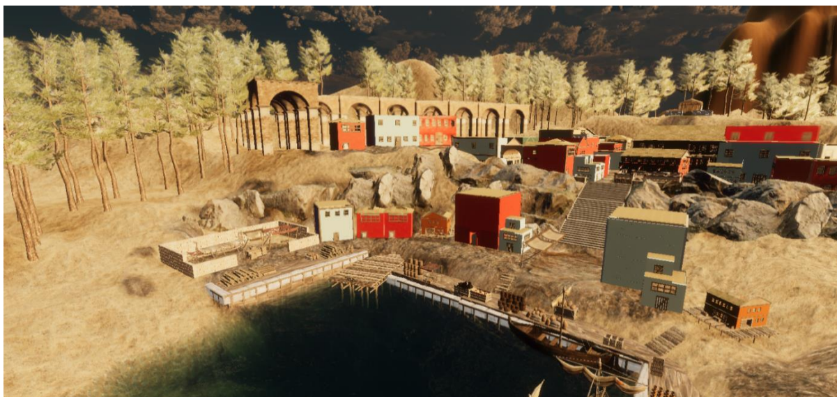
Εικόνα 2: Ο οικισμός Ακρωτηρίου και του λιμανιού, όπως φαίνεται με χρήση του λογισμικού εικονικής πραγματικότητας (Σενάριο «Ο πρώτος πολιτισμός της Ευρώπης»)