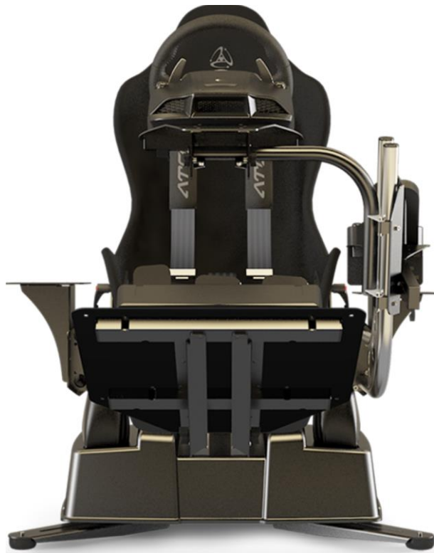
Εικόνα 1: Η πλατφόρμα κίνησης και μηχανικής ανάδρασης Activator