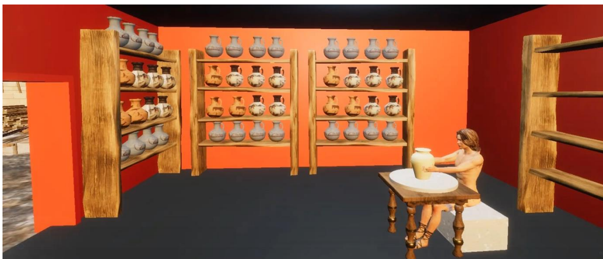
Εικόνα 3: Χαρακτήρες και αντικείμενα πολιτιστικής κληρονομιάς με τα οποία μπορεί να αλληλοεπιδράσει ο επισκέπτης