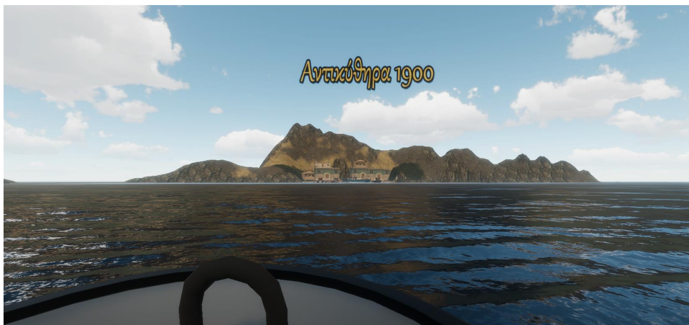
Εικόνα 5: Ο χρήστης επάνω στο σκάφος Ευτέρπη ετοιμάζεται για κατάδυση. Στο βάθος φαίνονται τα Αντικύθηρα (σενάριο «Το ναυάγιο των Αντικυθήρων»).

Στοιχεία αρμόδιου επικοινωνίας για το έκθεμα (όνομα, τηλέφωνο, email).